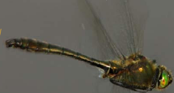
A. Cipierre, OPIE-MP

▲ Pas de ligne de taches jaune-crème au milieu du dos