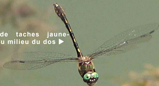
A. Cipierre, OPIE-MP

Ligne de taches jaune-crème au milieu du dos ►